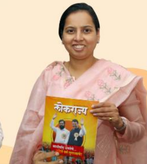
अदिती तटकरे मंत्री, महिला व बाल विकास