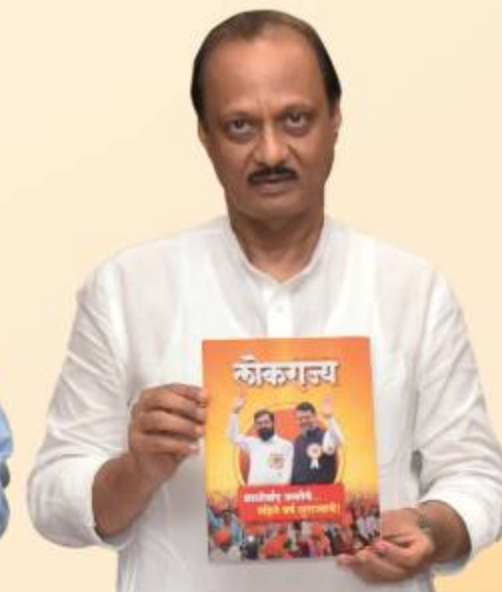
अजित पवार उपमुख्यमंत्री