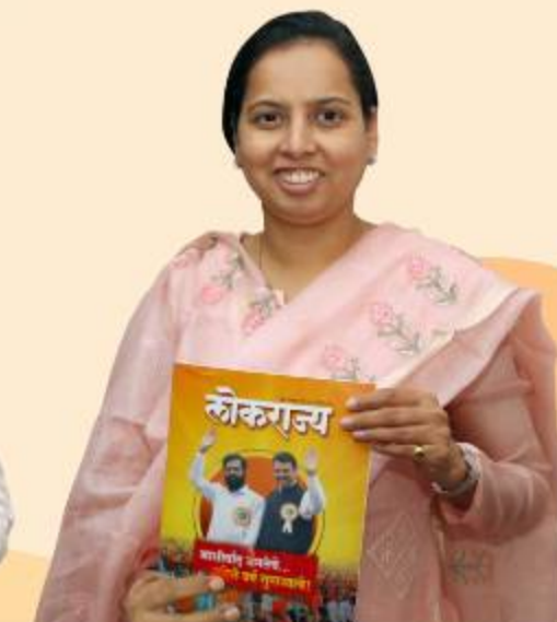
अदिती तटकरे मंत्री, महिला व बाल विकास